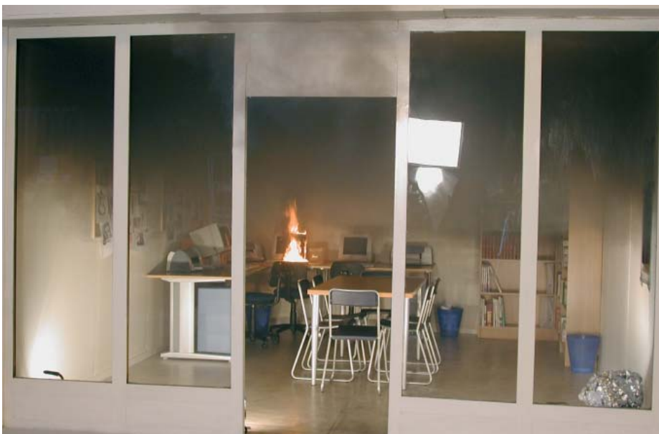
Simulerad brand i skoldatorsal. Branden anlagd i en datorskärm. Tändkällan motsvarar ett stearinljus.

Både en ordentlig forskningsvolym och tidsram är nödvändig om man skall kunna åstadkomma verklig förändring angående antalet anlagda bränder varför man föreslår en forskningsvolym på ca 5-6 Mkr per år under 5 år.