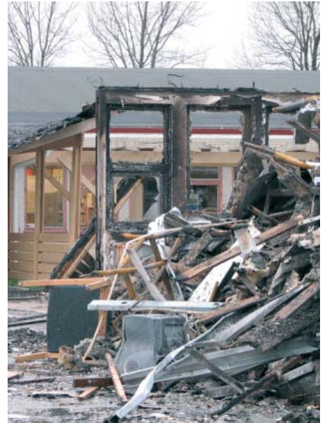
Resterna efter en anlagd brand i Hjällsnässkolan, november 2007.

Forskningsprogrammet har som målsättning att ta ett samlat grepp kring anlagd brand. Fokus är på bränder i skolor men man kommer även att beakta anlagda bränder i andra intressanta objekt som t ex centrumanläggningar och lastkajer.